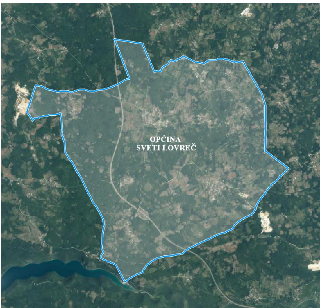
Slika 1. Općina Sveti Lovreč

Općina Sveti Lovreč nalazi na zapadnom dijelu Istarske županije, a sastoji se od 23 naselja Čehići, Heraki, Jakići Dolinji, Jurcani, Kapovići, Frnjolići, Knapići, Kršuli, Ivići, Lakovići, Medaki, Medvidići, Orbani, Pajari, Perini, Radići, Rajki, Stranići kod Sv. Lovreča, Vošteni, Zgrabljici, Krunčići, Selina i Sv. Lovreč Pazenatički. Općina Sveti Lovreč graniči s Gradom Poreč-Parenzo i Rovinj-Rovigno, te općinama Vrsar-Orsera, Kanfanar i Tinjan. Općina Sv. Lovreč se prostire na 30,61 km 2 , a prema popisu stanovništva iz 2021. godine Općina Sveti Lovreč ima 960 stanovnika.